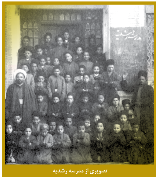
تصویری از مدرسه رشديه

از کارهای دیگر او در زمان صدارت تأسیس کارخانه قند کهریزک (با سرمایه داخلی و خارجی و به دست مهندسين بلژیکی) و تأسیس کارخانه کبریت‌سازی در الهیه شمیران بود امین‌الدوله در وصیت‌نامه خود چنین نوشته است: