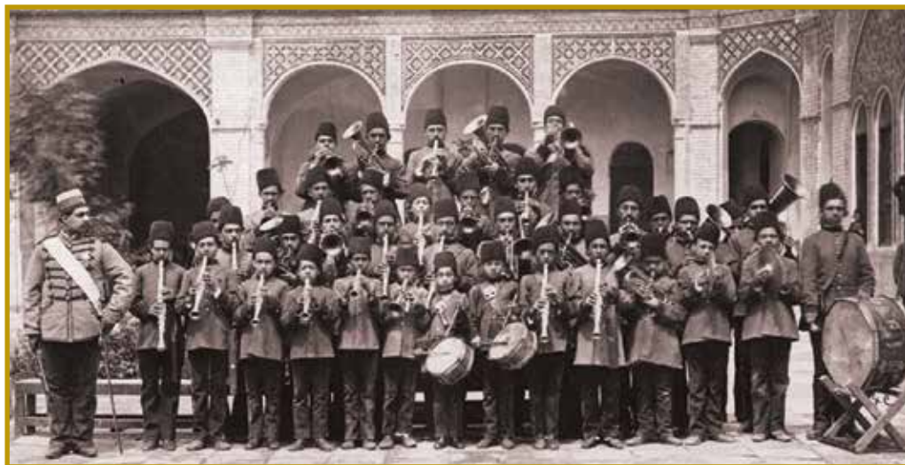
تصویر ۱. غلام‌بچگان محصل علم موزیک در مدرسه دارالفنون