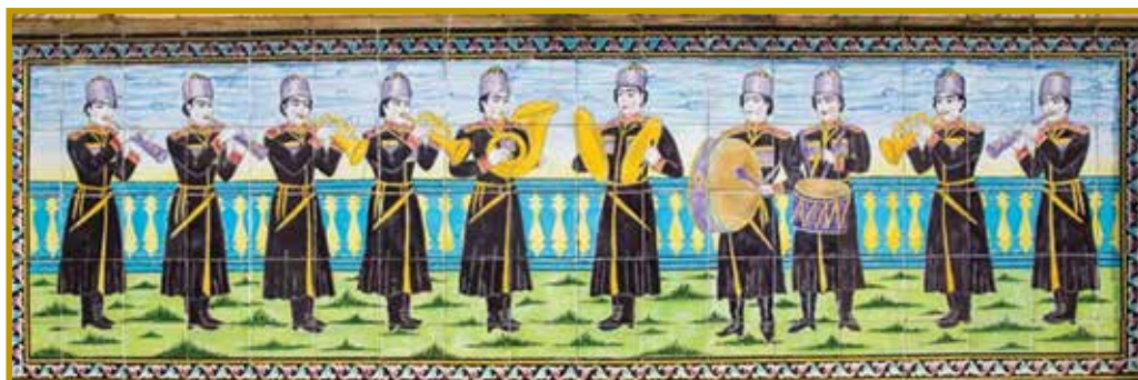
تصویر ۲. غلام‌بچگان نوازده بر کاشی کاری کاخ گلستان