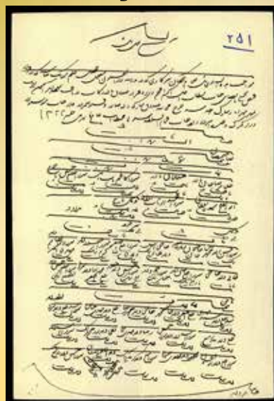
سند شماره ۲