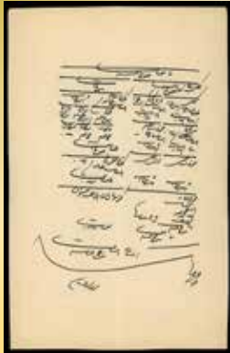
سند شماره ۱ (پشت)