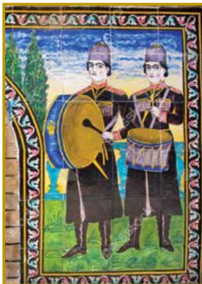
تصویر ۳. غلامبچگان نوازده بر کاشی کاری کاخ گلستان