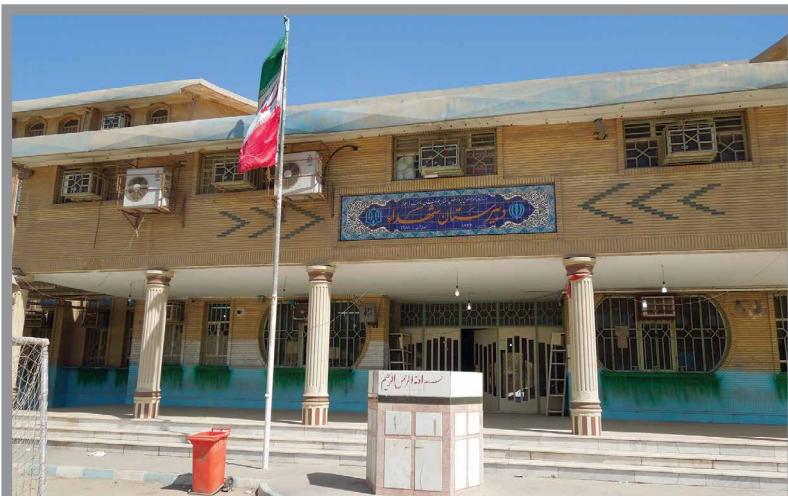
دبیرستان شهدای اهواز ( کریم فاطمی پیشین )