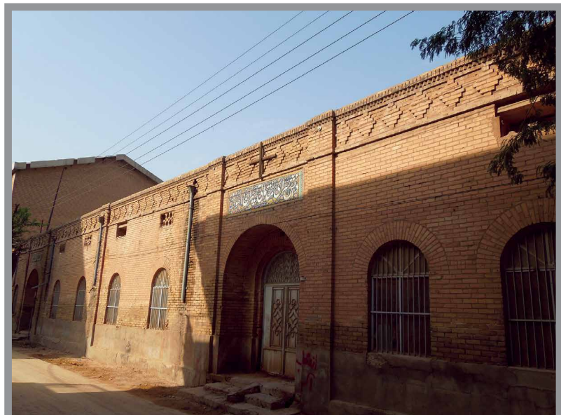
نمای ساختمان کلاس‌های دانشسرای مقدماتی اهواز