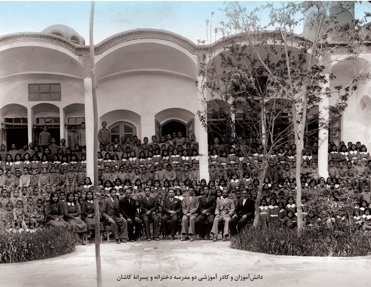
دانش آموزان و کادر آموزشی دو مدرسه دخترانه و پسرانه کاشان