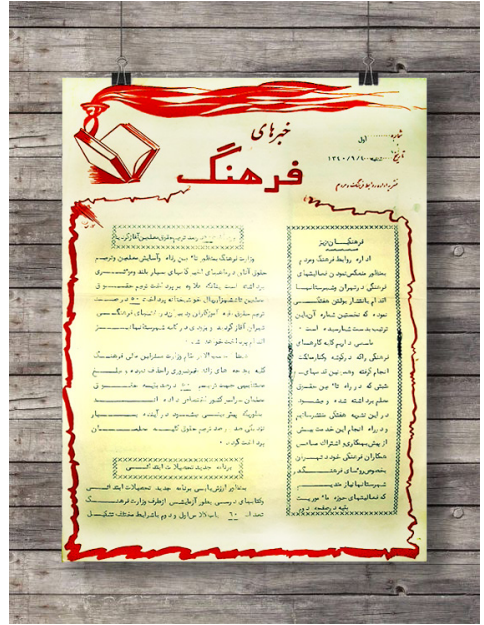
تصویر ۱. صفحه نخست نشریه «خبرهای فرهنگ»