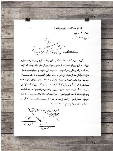
تصویر ۴. مکاتبه محرمانه از طرف وزیر فرهنگ مبنی بر عدم مصاحبه و اطلاع رسانی مسئولین وزارت فرهنگ