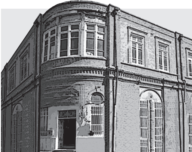
نمای ساختمان مدرسه دارالفنون تبریز