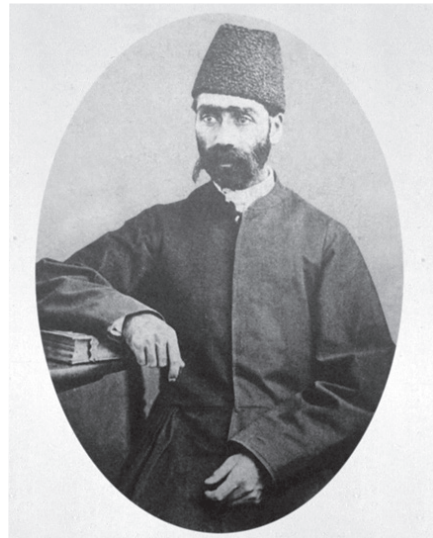
۱ میرزا علی اکبرخان نقاشی‌م‌زین‌الدوله نخستین معلم ایرانی نقاشی مدرسه دارالفنون

با ظهور رنسانس یا عصر نوزایی در ایتالیا که مقوله هنر، بازتابی عظیم در جهان ایجاد کرد، نه تنها آکادمی‌های هنری جنبه رسمی یافتند، بلکه از سده شانزدهم میلادی به بعد، از مدارس غیرسنتی که به آموزش‌های تئوری و هنری نوین، با تأکید بر درک و اجرای اصول و معیارهای رسمی و نظری کلاسیک‌گرایی رنسانس و سنت طبیعت‌گرایی می‌پرداختند، با عنوان آکادمی هنر یاد می‌شد.