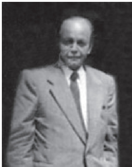
صمصام‌خان ذوالفقاری مصور الممالک

درباره این معلمان در شماره‌های بعدی به تفصیل سخن خواهیم راند.