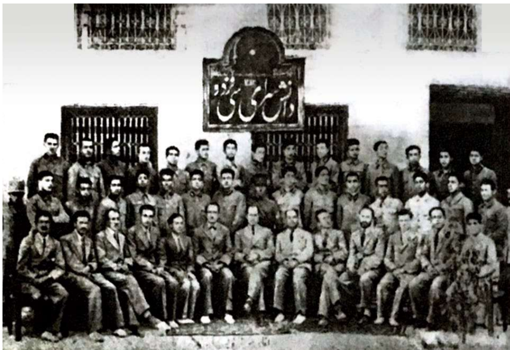
↑ دانش آموزان دوره اول دانشسرای فردوسی، با حضور علی محمد پرتوی، رئیس معارف فارس و دبیران سال ۱۴-۱۳۱۲ منبع: امداد، ۱۳۸۵، ص ۴۳۹

علاوه بر شیراز در بوشهر نیز کلاس‌های دارالمعلمین بعد از ظهرها در مدرسه سعادت برگزار می‌گردید. از یکی از اعلان‌های به دست آمده درباره تشکیل کلاس‌های دارالمعلمین بوشهر چنین برمی‌آید که عموم معلمین مدرسه سعادت موظف به حضور مستمر در این کلاس‌ها بودند تا بتوانند نواقص تحصیلی و فنی خود را تکمیل نمایند. (ر.ک پیوست؛ سند شماره یک) البته به نظر می‌رسد ساختار دارالمعلمین شیراز و بوشهر با آنچه در قانون ۱۲۹۷ مصوب مجلس شورای ملی بود، متفاوت بوده است.