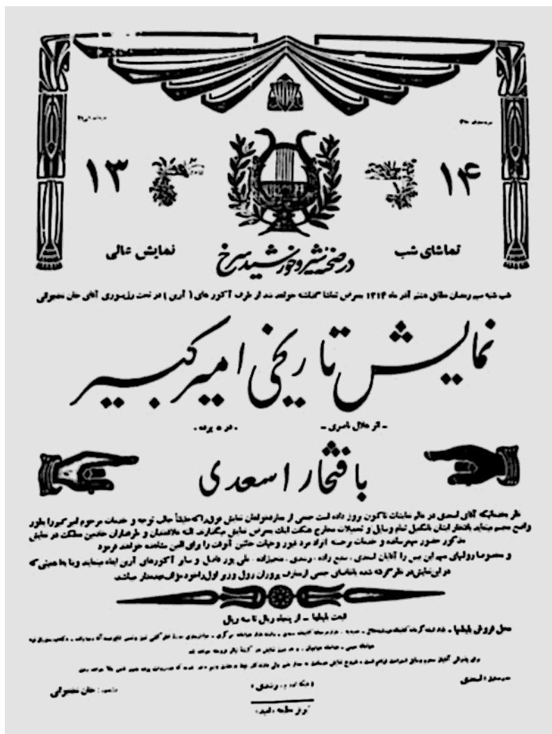
پوستر نمایشنامه تاریخی امیرکبیر، نوشته هلال ناصری، تبریز، ۱۳۱۴ خورشیدی

همچنین در سال ۱۳۵۶ش، پرویز زاهدی (۱۳۱۲-۱۳۹۷ش) مجموعه تلویزیونی میرزا تقی خان امیرکبیر را نوشت و انتشارات سروش آن را منتشر کرد. این سریال تلویزیونی، به کارگردانی سعید نیک‌پور، از اردیبهشت ۱۳۶۴، از شبکه اول سیما پخش شد و یکی از مجموعه‌های پرطرفدار دهه ۱۳۶۰ محسوب می‌شود. شایان ذکر است که در زمستان ۱۳۹۳ش این مجموعه را حامد عزیزی برای رادیو تنظیم کرد و به مناسبت سال‌مرگ امیرکبیر از شبکه رادیونمایش پخش شد.